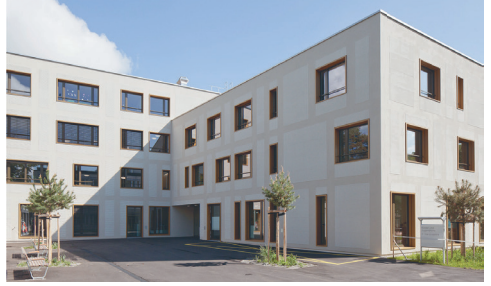
Kinder- und Jugendpsychiatrische Klinik Königsfelden