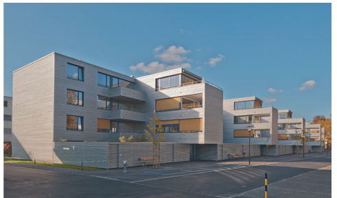
Wohnüberbauung Viehmarktareal Lenzburg