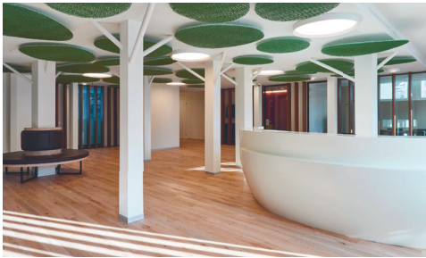
Umbau Raiffeisenbank Würtenlingen