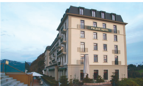
Hotel Palace Bürgenstock Obbürgen