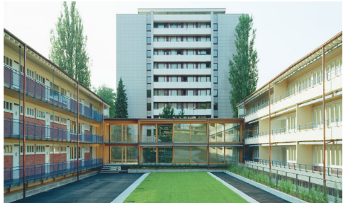
Sanierung Siedlung Spitalstrasse Luzern