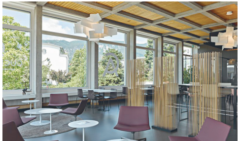
Fresh up Cucina Arte Solothurn