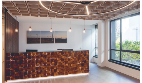
Alerion Clean Power Milano