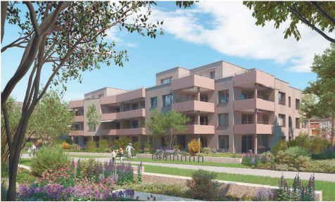
Wohnüberbauung Mattenpark Othmarsingen