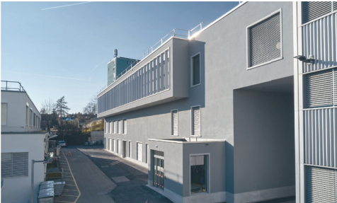
Cilag Microbio Lab Schaffhausen