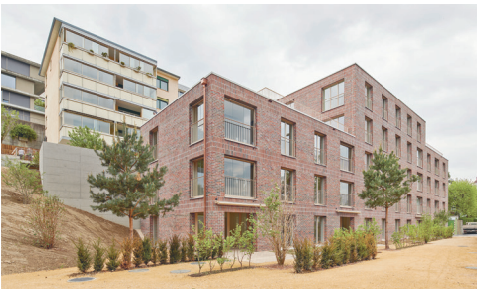
Mehrfamilienhaus St. Karlstrasse Luzern