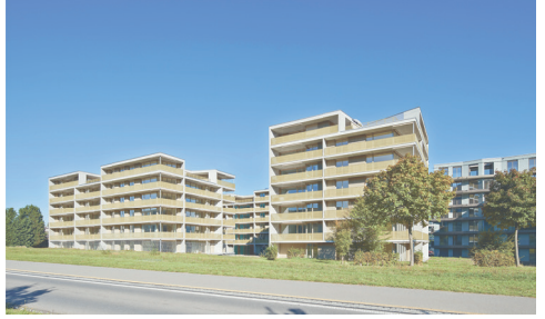
Wohnbauten Schweighof Kriens