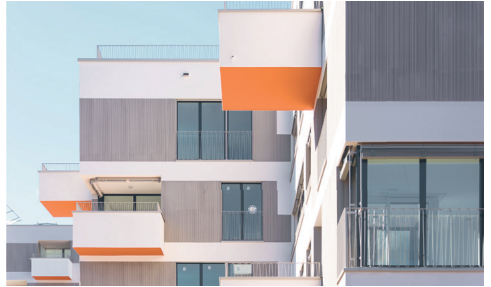
Zopfmatte, Bedürfnisgerechtes Wohnen Suhr