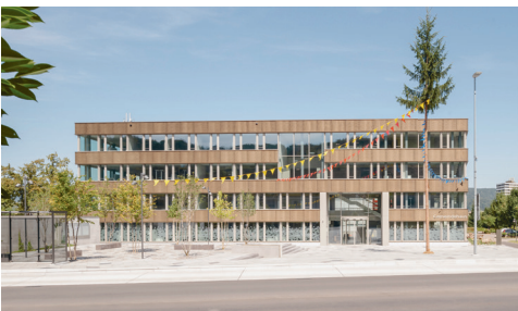
Neubau Gemeindehaus Spreitenbach