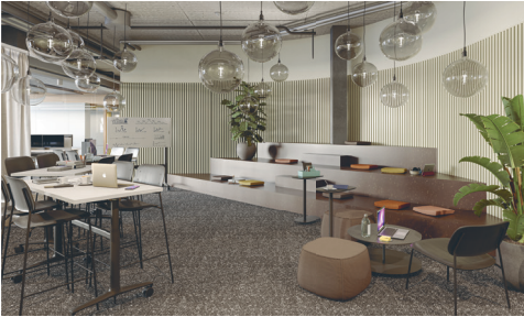
Johnson & Johnson Allschwil