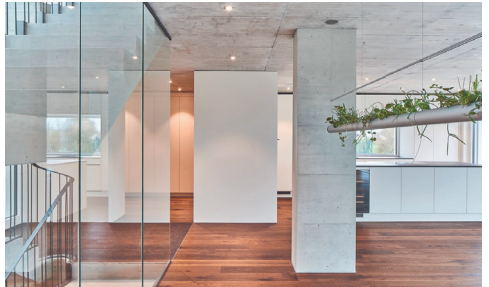
Neubau Residence Lueg Feldbrunn