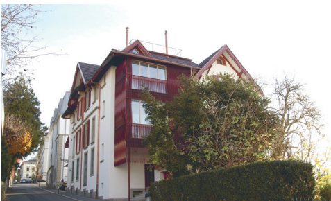
Umbau Wohnhaus Adligenswilerstrasse Luzern