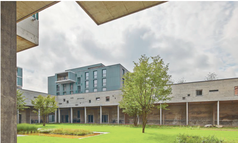
Wohnen im Bethlehem Immensee