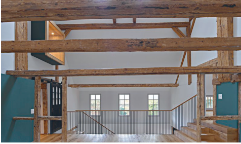
Umbau ehemaliges Bauernhaus Solothurn