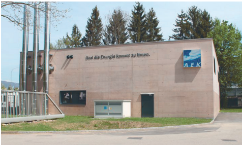
Neubau Energiezentrale Bellach