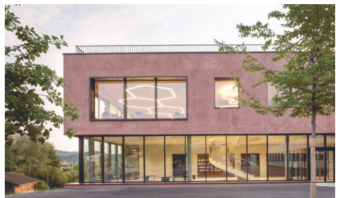
Schulungs- und Konferenzzentrum FiBL Frick