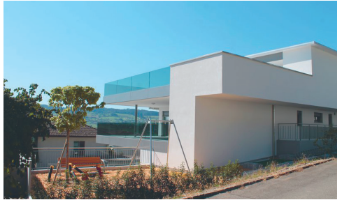
Neubau Mehrfamilienhaus Triengen