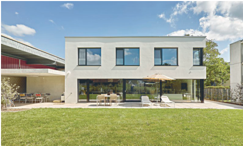
Neubau Einfamilienhaus Selzach