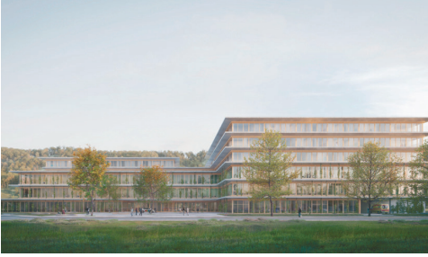
Spitalzentrum Biel - Brügg