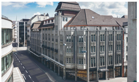
Hotel Seidenhof Zürich