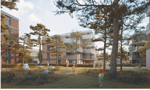
Wohn- und Gewerbeüberbauung Salzhof Suhr