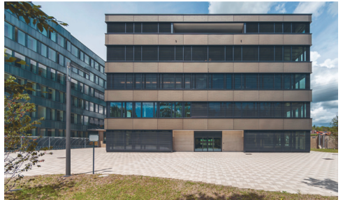
FLUX EAWAG Neubau Laborgebäude EMPA Areal Dübendorf