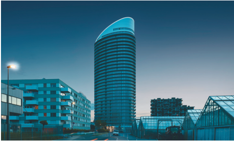
Jabe Tower Dübendorf