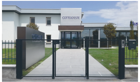
Office Cotto d'este' Sassuolo