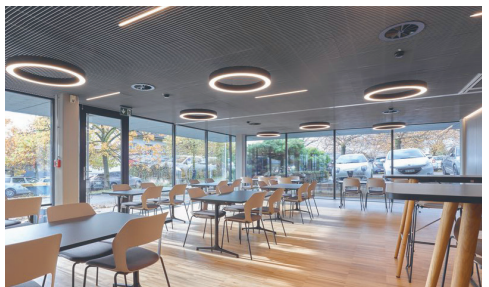
Umbau Personalrestaurant Lengnau